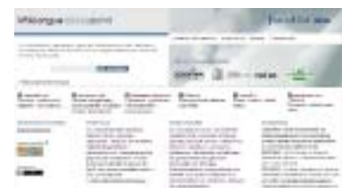
► La página fue presentada ayer en Madrid.

El sitio ideado por la Funde BBVA, sigue el modelo de la enciclopedia virtual Wikipedia: los usuarios de Internet pueden consultar y modificar. Pero mientras que algunos foros pueden prestarse a errores u opiniones encontradas, los fundadores de Wikilengua dicen que su iniciativa