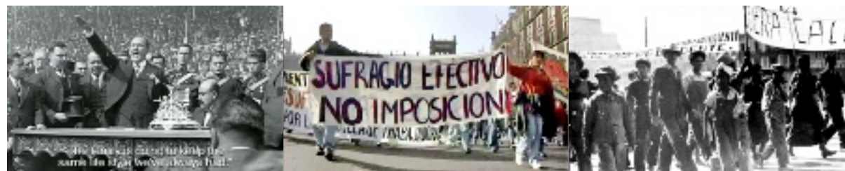
► Secuencia de imágenes del documental "El general", que propone un diálogo entre el pasado y el presente de México.